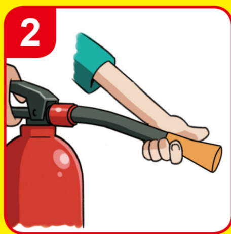
노즐을 잡고 불쪽을 향한다 Aim at the base of the fire