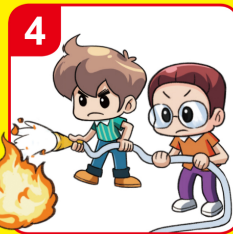
불을 향해 쏜다 Extinguish the fire