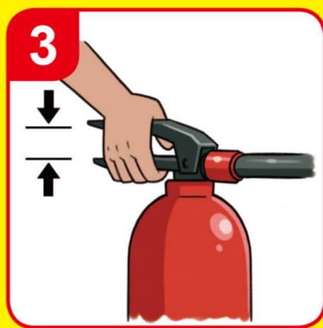
손잡이를 움켜쥐는다 Squeeze the handle