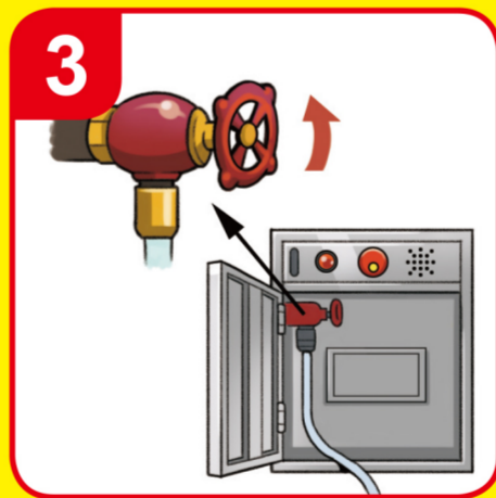
밸브를 돌린다 Open the valve