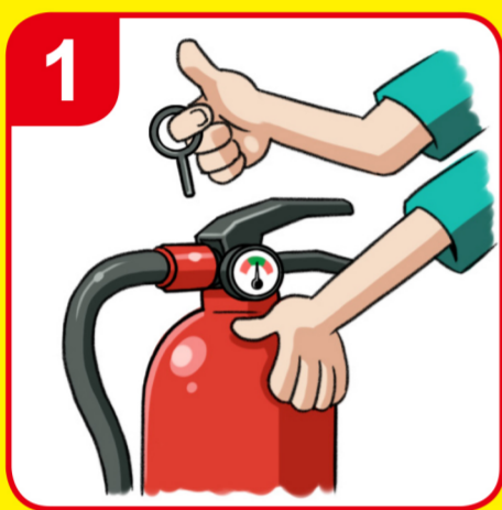
안전핀을 뽑는다 Pull the pin