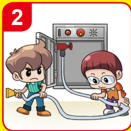
호스를 빼고 노즐을 잡는다 Take out the hose