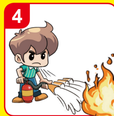
분말을 골고루 쏜다 Sweep from side to side